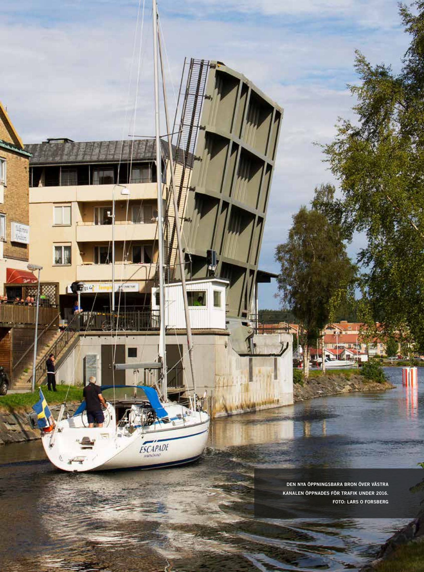
DEN NYA ÖPPNINGSBARA BRON ÖVER VÄSTRA KANALEN ÖPPNADES FÖR TRAFIK UNDER 2016.