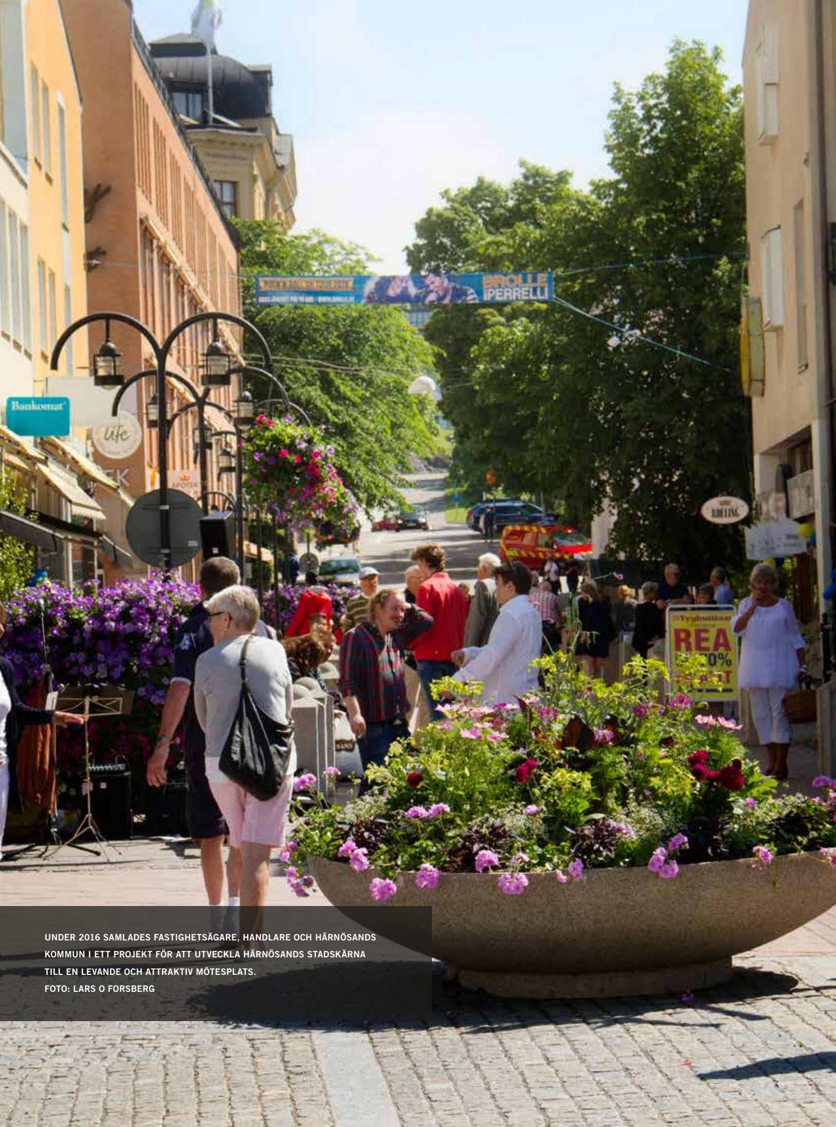
UNDER 2016 SAMLADES FASTIGHETSÄGARE, HANDLARE OCH HÄRNÖSANDS KOMMUN I ETT PROJEKT FÖR ATT UTVECKLA HÄRNÖSANDS STADSKÄRNA TILL EN LEVANDE OCH ATTRAKTIV MÖTESPLATS.